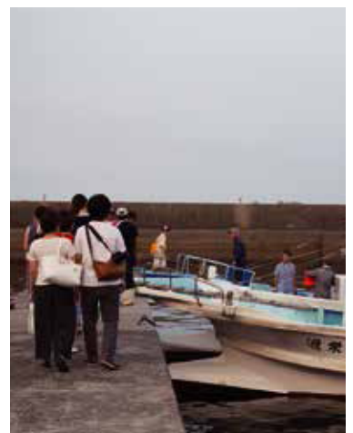
住宿別府溫泉區域的旅客，推薦從別府 楠港出發(體驗時間60分鐘~90分鐘 3,500日圓)