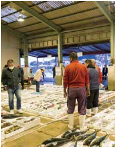
Morning market at Oga Port (closed on every Sundays and every other Wednesdays)