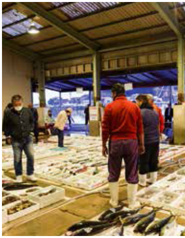
每天早上營業的大神漁港的早晨魚市場 (週日・隔週三休息)