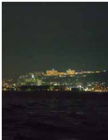
"Night View Cruise" - you can enjoy the night view of Beppu or the industrial area of Oita (90mins ¥3,500)