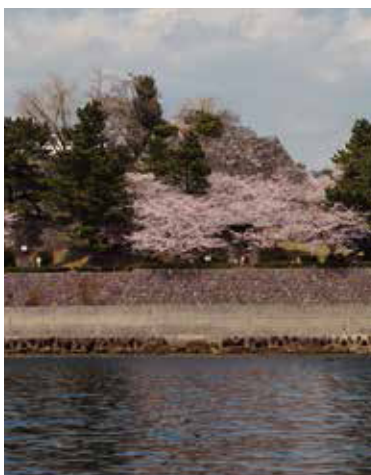
從海上眺望城址遺跡的「短程漁船體驗」是最輕鬆簡便的行程(30分鐘 2,000日圓)