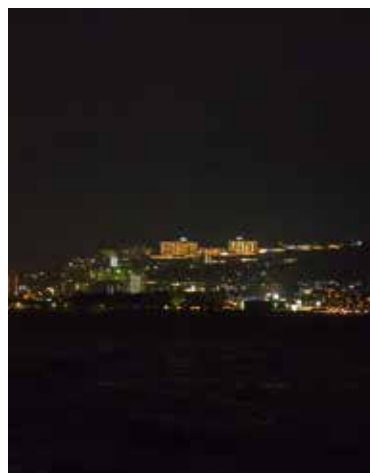
벳푸만의 야경 or 오이타 공장지대의 야경을 즐기는 '야경 크루즈' (90분, 3,500엔)