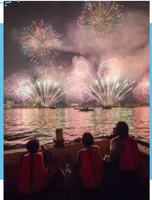
Highly Recommended! "Fireworks Cruise" (90mins ¥3,500) *this course is not held every- day.

"You can choose a course and time (morning / daytime / night) for the fishing boat cruise and you can enjoy the view from the calm Beppu-wan Bay. Experience these unique plans with fisherman nowhere but only in Hiji Town.