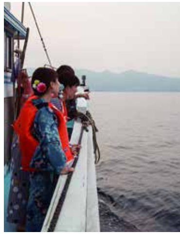
能一次享受日出的美景與早晨魚市場的 「朝市漁船體驗」是最受歡迎的行程(90 分鐘 3,500日圓)