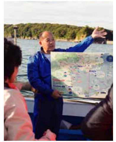
어부가 직접 만든 지도로 바다에서 보이는 경치를 안내해 드립니다.