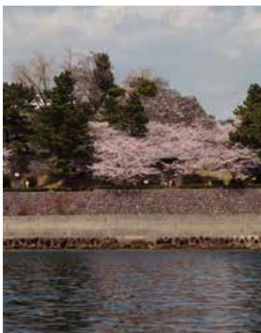
바다에서 성터를 바라보는 '미니 크루즈'는 간편하게 즐길 수 있는 코스입니다. (30분, 2,000엔)