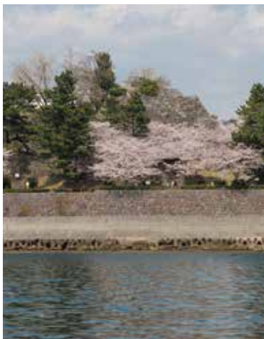
Quick course - "Mini Cruise". Enjoy the view of the castle ruins from the sea (30mins ¥2,000)