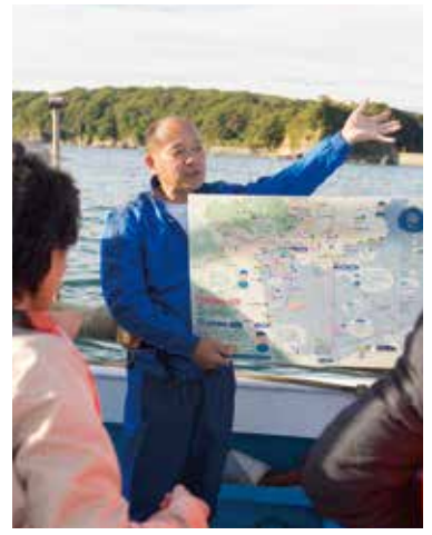
Fisherman will use the original map to give you the guidance of the view from the sea.