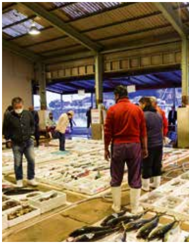
오가미어항의 아침 시장(일요일, 격주 수요일 휴일)