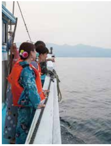
"Morning Market & Cruise" course which you can enjoy both the market and the sunrise is the most popular course (90mins ¥3,500)