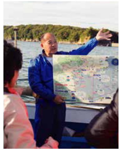
親切的漁夫嚮導用原創的地圖為大家詳細 導覽從海上看到的景色。