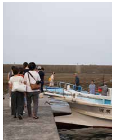
Those who stay in Beppu Onsen Hot Springs, select Beppu Kusunoki Port as your arrival/departure point (60-90mins ¥3,500)