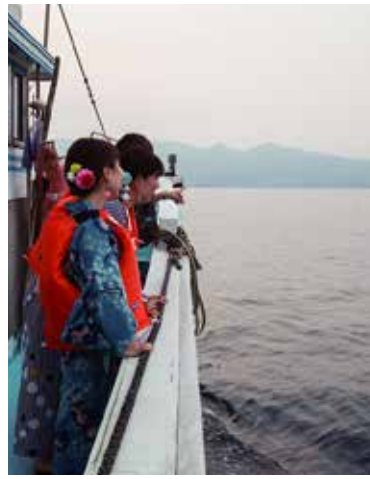
일출과 아침 시장을 한꺼번에 즐길 수 있는 '아침 시장 크루즈'는 가장 인기가 있는 코스입니다. (90분, 3,500엔)