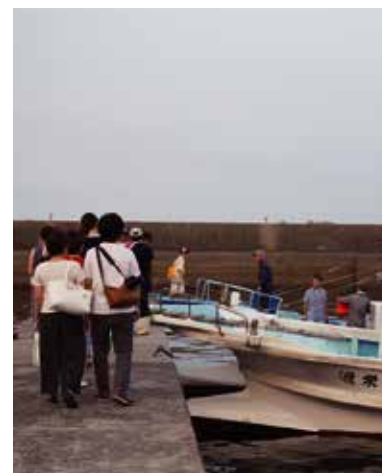
벳푸 온천에 숙박하시는 분은 벳푸쿠수노키항 출발/도착 코스를 추천합니다. (60분~90분, 3,500엔)