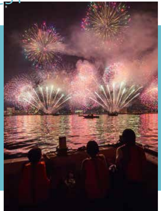
'불꽃축제 크루즈'(90분, 3,500엔) *불꽃축제가 열리는 날에만 운항합니다.

평온한 벳푸만의 바다 경치를 즐기는 크루즈는 시간(아침/낮/밤)과 코스를 선택할 수 있습니다. 오직 히지에서만 체험할 수 있는 특별한 관광 플랜입니다.